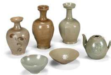
진안 수천리무덤 출토 청자편