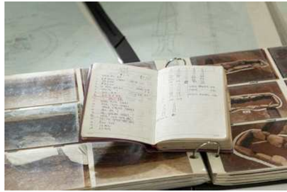
용담댐 수몰지구 발굴조사 앨범, 도면, 수첩