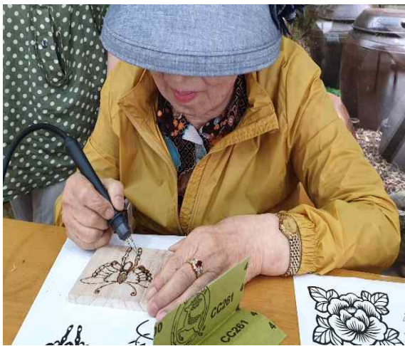
현판 만들기 낙죽 체험