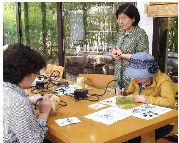
낙죽 체험 현장