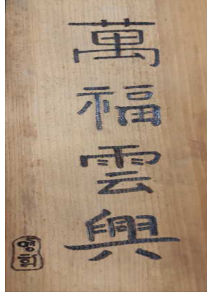
현판 만들기 작업 물