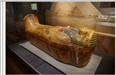
[명칭] 파세바카이엔이페트의 관 [소장처] 미국 브루클린박물관