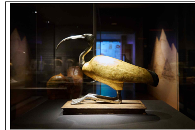
[명칭] 따오기 관 [소장처] 미국 브루클린박물관