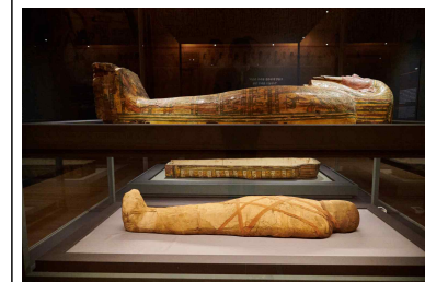
[명칭] 토티르데스의 관에서 나온 미라 [소장처] 미국 브루클린박물관