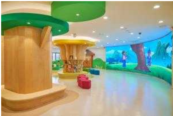
사진1. 어린이박물관 '영상놀이터'