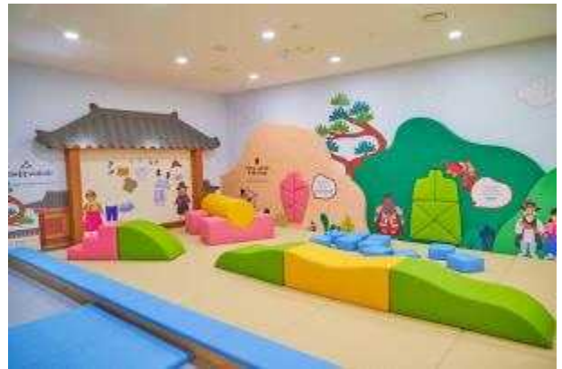
사진2. 영유아를 위한 <쌓고 노는 문화재놀이터>