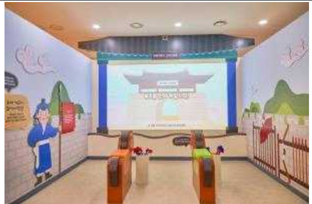
사진6. '선비의 살이실'의 <투호를 던져>