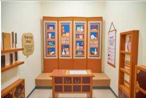
사진5. '선비의 살이실'의 <선비의 공부방>