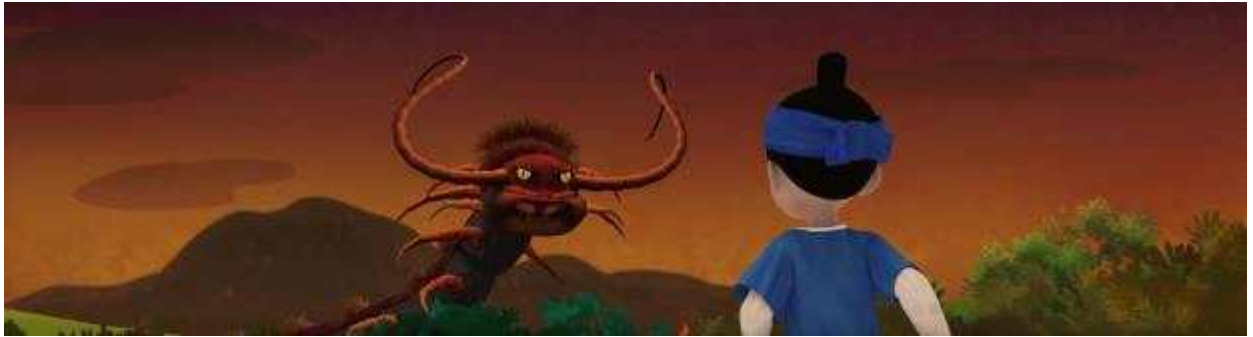
사진3. 어린이박물관 '영상놀이터' <한벽당과 지네이야기>