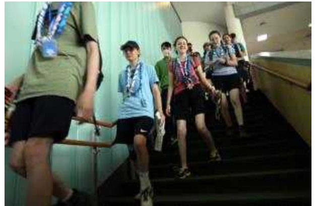
국립전주박물관을 찾은 세계스카우트멤버리 대원들