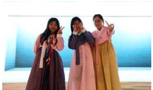
한복부스 체험 중인 세계스카우트멤버리 대원들