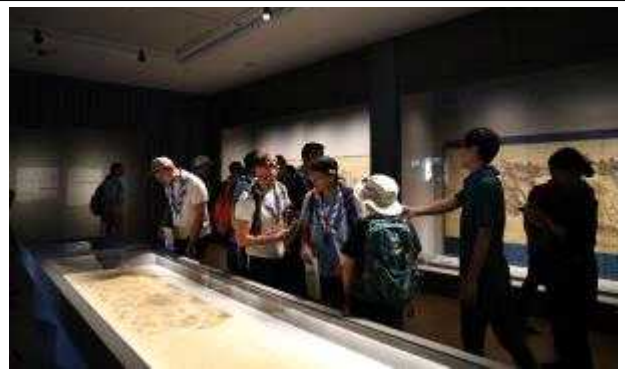
세계스카우트멤버리 대원들의 특별전 <아주 특별한 순간-그림으로 남기다> 관람