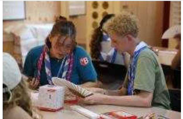
한국 전통 부채 체험 중인 세계스카우트멤버리 대원들